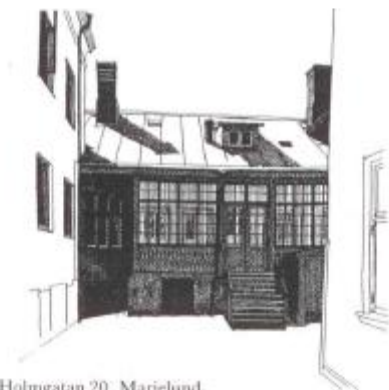
47. Västra Holmgatan 20, Marielund.