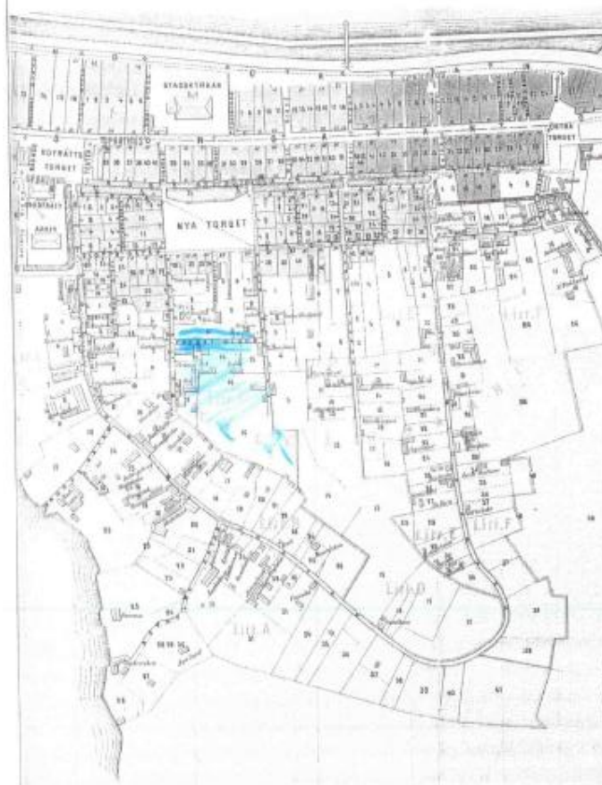
45. Detalj av Plankarta över Jönköpings stad 1879.