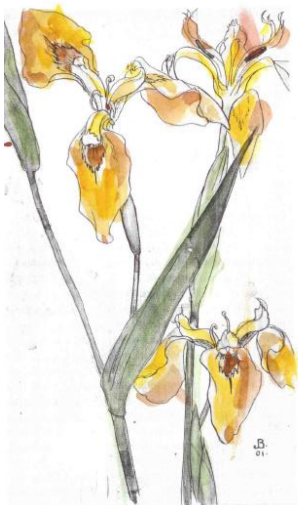
49. Akvarellskiss av John Bauer, signerad Sjövik 1901.