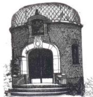
48. Västra Holmgatan 14, Nydals.

En ny väg har dragits söder om huset, men bättre är att närma sig Aspholmen från den smala stig som smyger mellan plank och hallonsnår på norra sidan. Denna för-